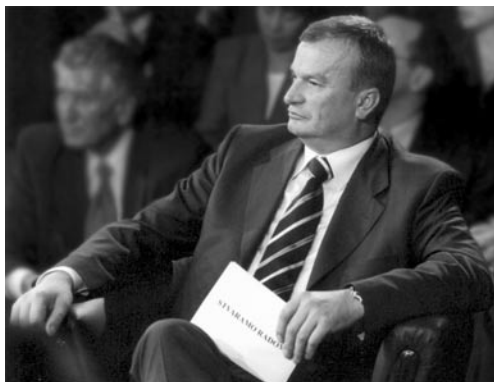
Предсједник Младен Иванковић Лијановић